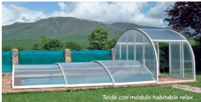
Teide con módulo habitable relax